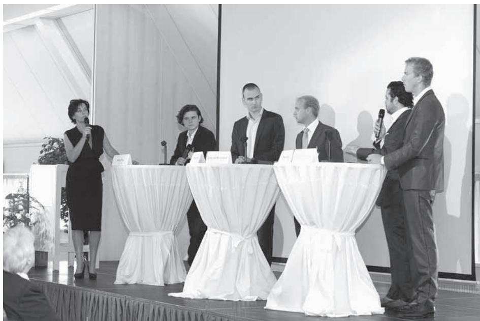
Forumdiscussie Schepping, samenleving en de nieuwe generatie ,

Niet voor niets hebben economie en ecologie dezelfde Griekse wortel: oikos , huis. Rentmeesterschap is de zorg voor ons huis. Rentmeesterschap is normstellend, en erop gericht om alle vormen van kapitaal in stand te houden: sociaal, cultureel, fysiek, economisch en financieel. En de geest van rentmeesterschap kan het beste gedijen in een cultuur waarin burgers zelf verantwoordelijkheid nemen. Niet alleen voor zichzelf, maar voor elkaar, én voor hun omgeving. Dat is de missie van rentmeesterschap, waar wij als christenen voor staan. Dat is al vanaf 1891 de missie van het Christelijk Sociaal Congres.