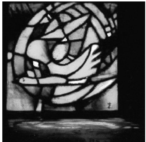
Glas in loodraam uit de kerk van de Verzoening, Taizé, Frankrijk