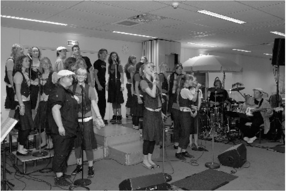
De uitreiking van de Adriaan Borstprij werd feestelijk ondersteund door een optreden van de Young Continentals