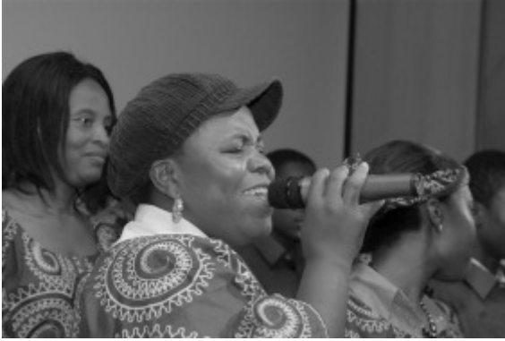
Pentecost Revival Church Choir uit Amsterdam