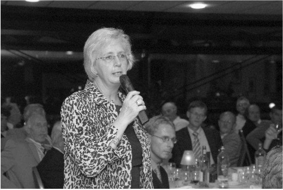
Tafelspeech voor het Christelijk Sociaal Congres, mevrouw A.M.A. van Ardenne-van der Hoeven, Minister voor Ontwikkelingssamenwerking

Mag ik beginnen met u van harte te feliciteren. U behoort vandaag nog tot de steeds kleiner wordende groep van Nederlanders die aan tafel gaat, aan tafel zit – zelfs een gedekte tafel – voor het diner. Er is vandaag voor u gekookt. Zo te zien een meergangendiner met een goed glas wijn of water.