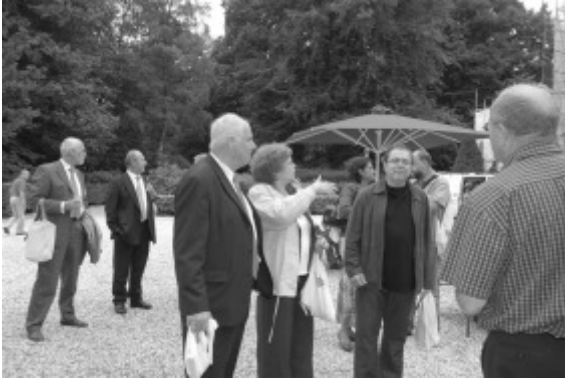
Tijdens de Emmaus Wandeling