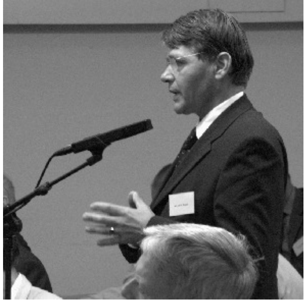
Scheidend voorzitter van de Stichting Christelijk-Sociaal Congres, Piet Hein Donner