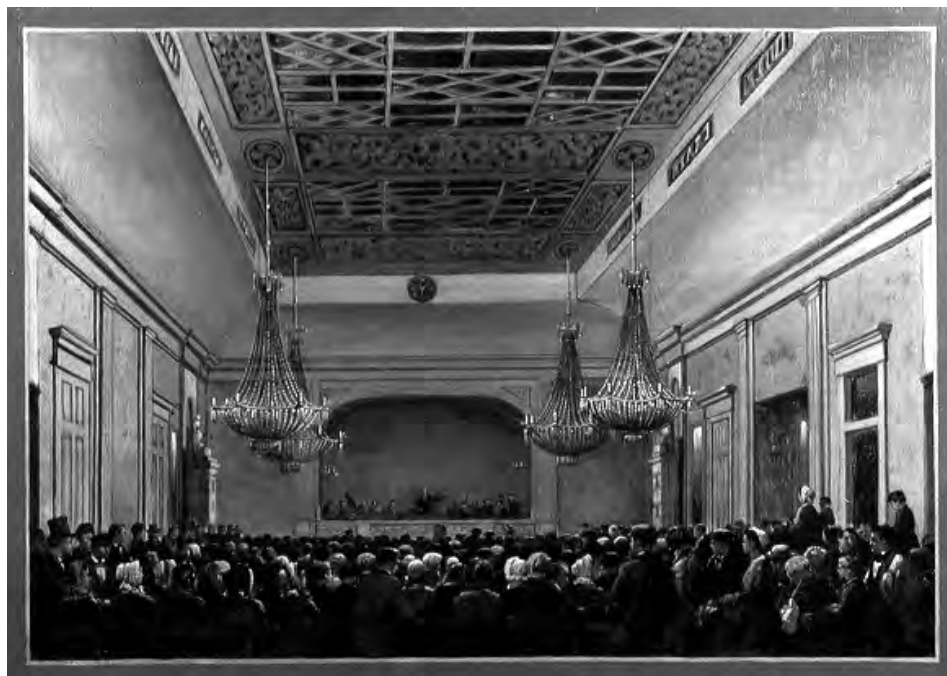
Opening van het nieuwe gebouw van de Maatschappij voor de Werkende Stand in Amsterdam op 13 juni 1883. In deze zaal werd in 1891 het Christelijk-Sociaal Congres gehouden.