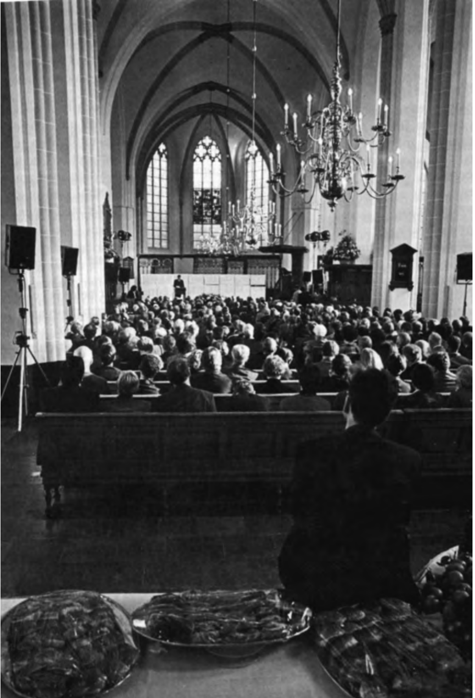
De slotmanifestatie van het Christelijk Sociaal Congres 1991, Jacobikerk, Utrecht