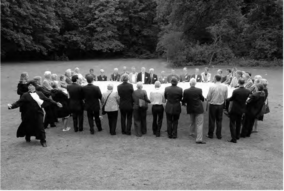
De verbeelding van het middenveld (2007)